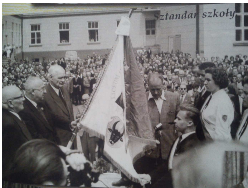
Wręczenie sztandaru pocztowi w czasie głównej uroczystości na boisku szkolnym, 10 maja 1959r.

Jednak tak ważna szkoła nie mogła pozostać bez sztandaru. Pierwotny Sztandar zastąpiono więc kolejnym - tym, który towarzyszy nam do dziś jako reprezentant szkoły. Nowy Sztandar (z emblematyką o świeckim charakterze) ofiarowany został szkole w czasie uroczystości Jubileuszu 55-lecia Liceum dnia 10 maja 1959 roku.