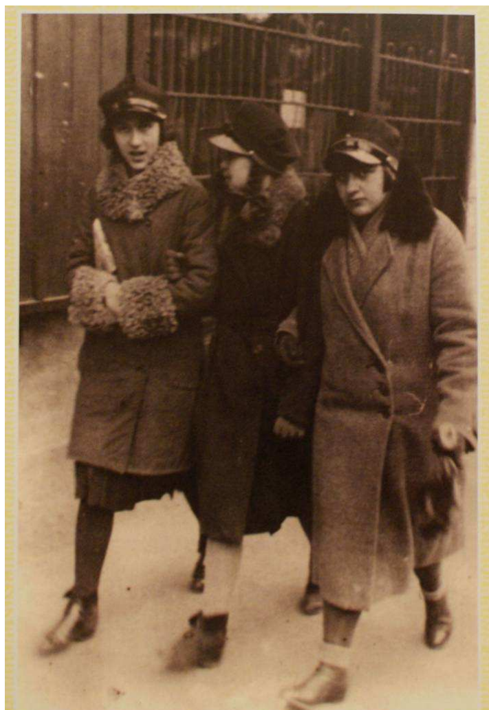
Uczennice w obowiązkowych (w pewnym okresie) czapkach szkolnych - w drodze do szkoły w roku 1932.